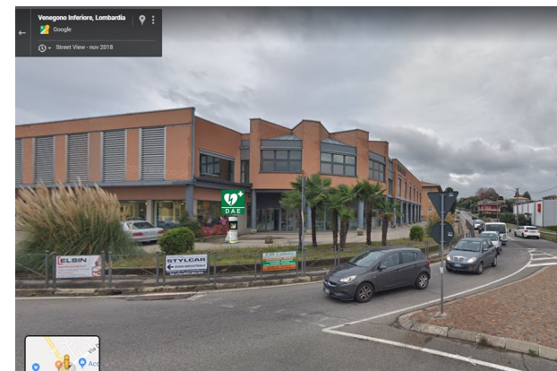
Proposta di posizionamento della colonnina di soccorso completa presso SS 233 Varesina