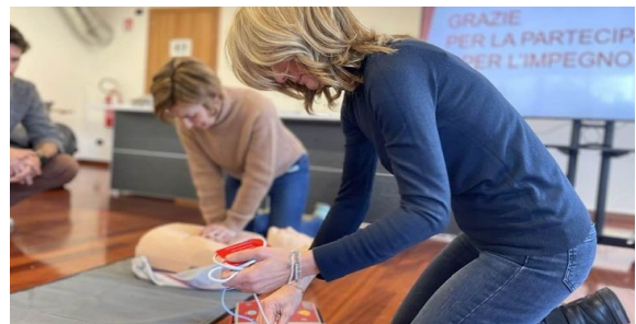
Corso BLS D Venegono Inferiore

disponibilità di tempo per questo importante ruolo ma nel mio periodo di presidenza, che si prevede sarà esteso per questioni di uniformità a 4 anni, cercherò di fare onore al compito che mi è stato affidato, chiedendo a voi tutti aderenti un aiuto morale e, nei limiti delle vostre possibilità, anche una collaborazione operativa per sviluppare nuove iniziative di interesse e di successo per tutta la popolazione venegonese.